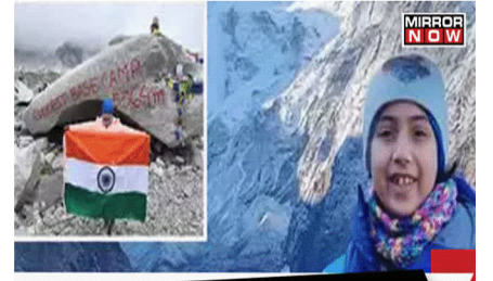
YOUNGEST INDIAN, FROM MUMBAI, REACHES EVEREST BASE